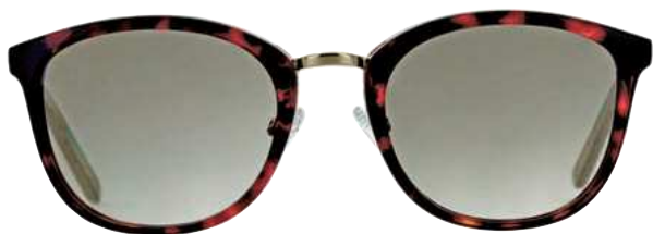
5. Röhm Eyewear