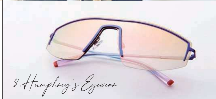
8. Humphrey's Eyewear