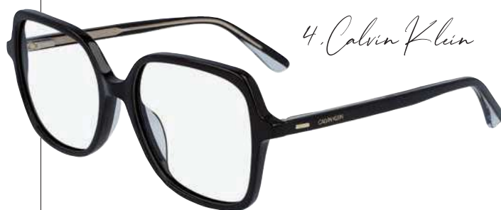
4. Calvin Klein

4 • Durch seine spezielle Oversize-Form im Schmetterlingsstil passt das Modell CK20528 (Farbe 001) aus der Classic-Kollektion von Calvin Klein optimal zu den Trends für 2021. Das Modell wurde aus Acetat gefertigt und besitzt an den Bügeln Designelemente, ein Logo aus Metall und wurde mit zweifarbigem, eingekerbten Bügelenden verziert. Das Modell verleiht dem Look Retro-Flair und ist auch in den Farben 235 (Dark Tortoise) und 424 (Navy/Crystal) erhältlich. | marchon.com