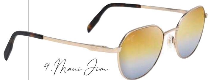
9. Maui Jim