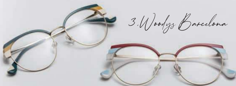
3. Woodys Barcelona

3 • Die Kombination von Materialien ist eine der Stärken von Woodys Barcelona . Die fünf Modelle der neuen Kollektion „Chances“ beweisen das einmal mehr. So auch das Modell Jellyfish mit einer Fassung aus Metall und italienischem Acetat mit dreifach laminierter Front in Pudertönen. Inspiriert vom Glamour des alten Paris ist es ein feminines, zartes Modell mit erhebenden Formen. | woodysbarcelona.com