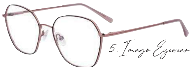
5. Imago Eyewear