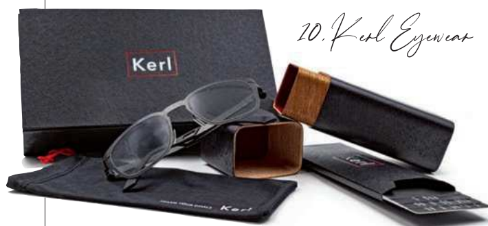
10. Kerl Eyewear

6 • Einzigartig anders: Das Damenmodell M 115 der Kollektion „ Conquistador “ hat eine extravagante Form, die verschiedene Formelemente verbindet. Die Individualität wird durch die feinen Fräsungen und eine zweifarbige Farbgebung verstärkt. Die Brillenfassung der Größe 55 ist filigran verarbeitet und sehr leicht, wodurch ein hoher Tragekomfort gegeben ist. Erhältlich bei Marwitz Berlin. | conquistador.de