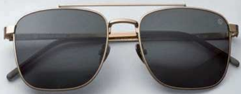
2. Nirvan Javan