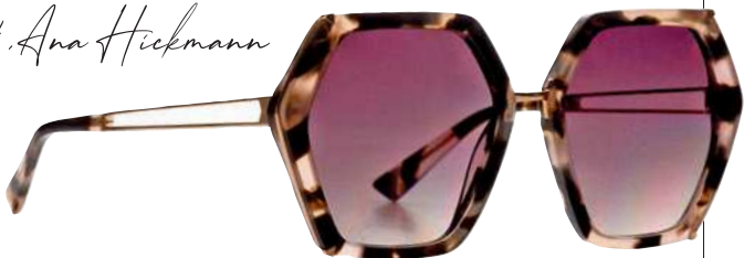
4. Ana Hickmann