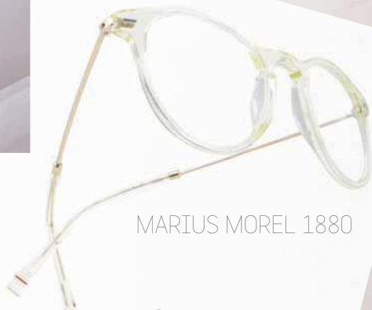
MARIUS MOREL 1880

Das Design knüpft an den Ursprung des Unternehmens Morel an: subtiler Neuinterpretation werden neue Klassiker geschaffen. Das Model Tydee wurde 1963 erstmals vorgestellt. 2016 – nach 63 Jahren hat Marius Morel 1880 das Model als Facelift neu interpretiert: Panto-Shapes und transparente Acetate. www.emmerich-exklusivbrillen.com